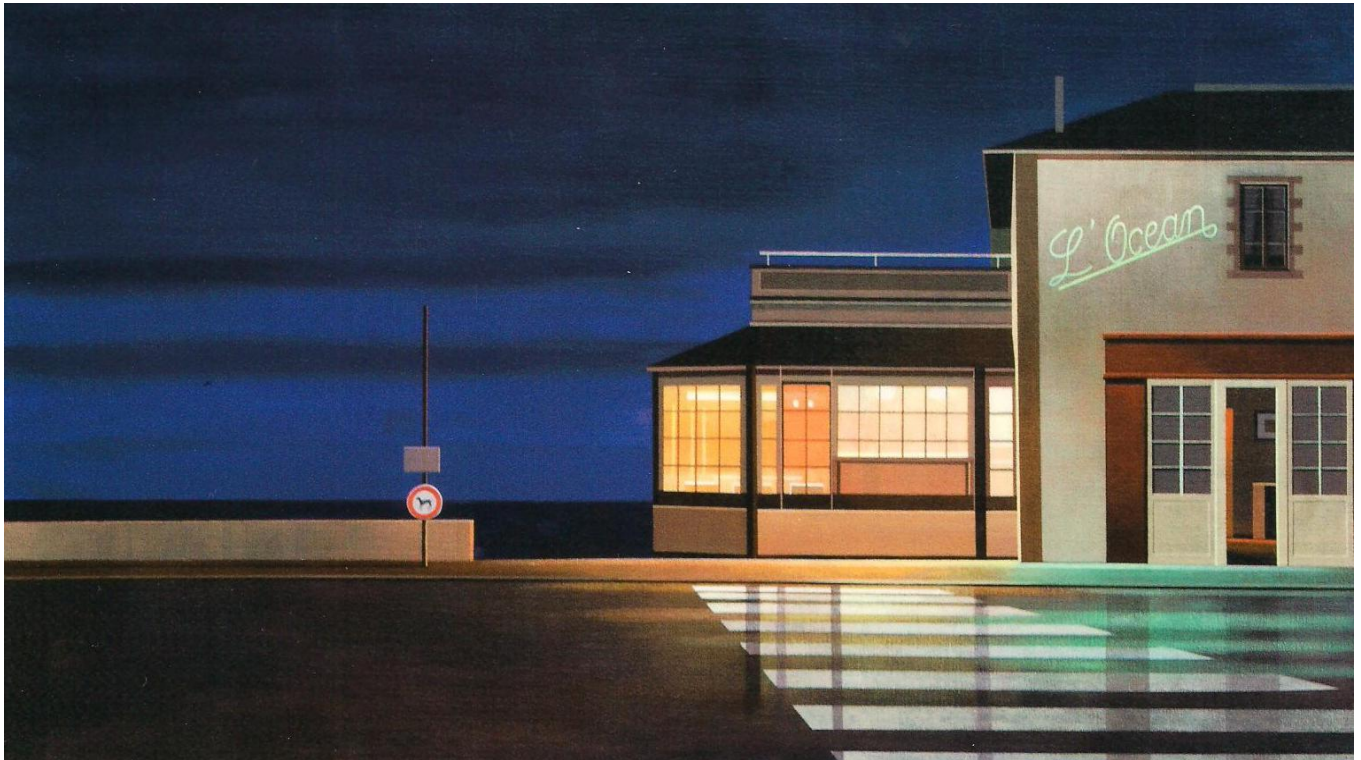
Patrick Savary, l'Océan, Öl auf Leinwand

Strukturen und Realität , Gemeinschaftsausstellung Oberwalliser und Unterwalliser Künstler Galerie zur Matze und Alter Werkhof Brig, 1. – 23. September 2012