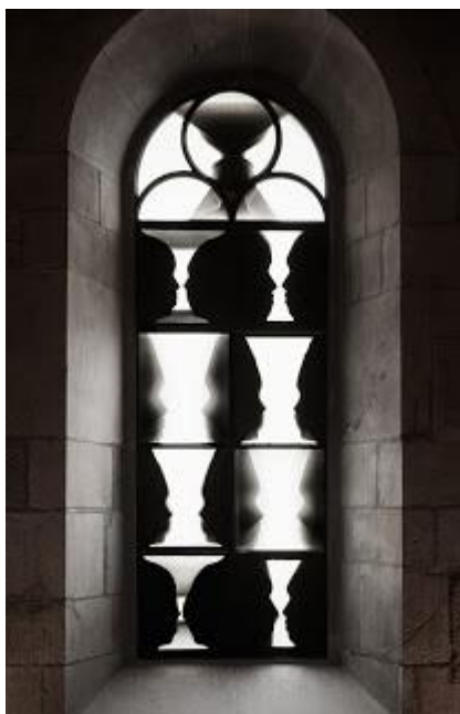
Ausschnitt des Kirchenfensters "der Menschensohn" im Grossmünster, Zürich von Sigmar Polke

Die Sammlung von historischen Kunstschatzen, Messbüchern, liturgischen Gewändern, Gefäßen, Reliquiaren, Heiligenfiguren und Monstranz der Kollegiums Kirche Spiritus Sanctus will man in dieser Ausstellung der breiten Bevölkerung zeigen. Ihr geht eine grossangelegte Restauration der Paramente, das heisst der Textilien, die der Gestaltung der Gottesdiensträume und dem Gebrauch im Gottesdienst dienen und der Gold- und Silberschmiedeobjekte, die zum Teil aus der Zeit der Jesuiten stammen, voraus. Der Verein „Freunde des Briger Kollegiums“ ermöglicht diese sehr aufwendigen und kostspieligen Restaurationen. Von Christi Himmelfahrt bis Fronleichnam, und somit über Pfingsten, erfolgt die Ausstellung des Kirchenschatzes in Zusammenarbeit mit dem Kunstverein Oberwallis. Eine zeitgenössische Präsentation bringt Spannung in diese ausserordentliche Ausstellung.